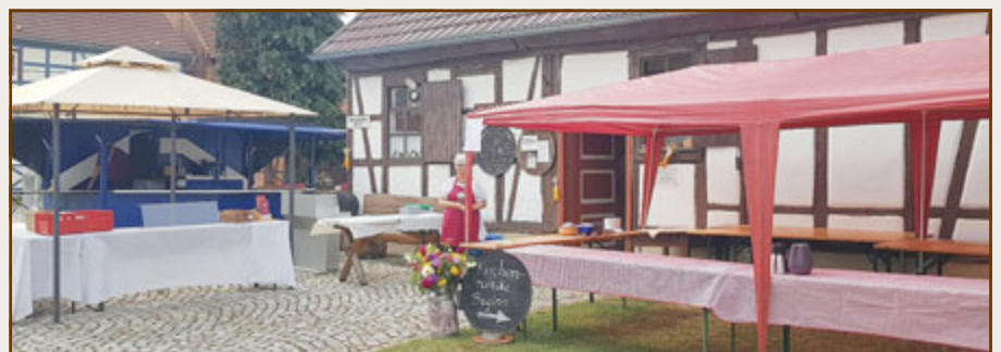
Backhausfest in Blankenburg