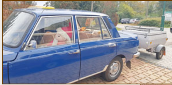
Rollendes Museum Kirchheiligen