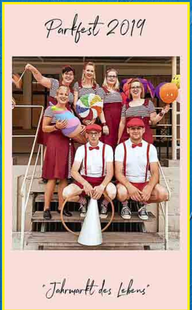
"Jahrmartt des Lebens"