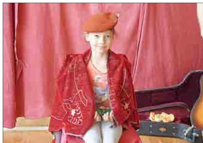
Die Erzieher der THEPRA Grundschule Kirchheilingen