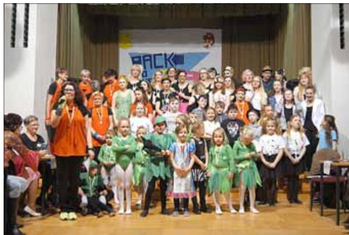
Der Bruchstedter Carneval Verein wünscht allen Bürgerinnen und Bürgern der VG ein Frohes Osterfest.