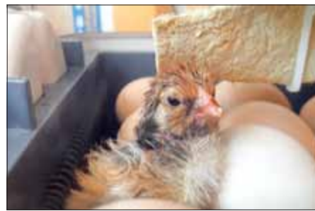
Das erste Küken ist da! Das Küken aus Ei Nummer 11 hatte es besonders eilig.