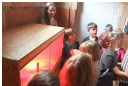
Gebannt lauschen die Schüler den Tipps für die Aufzucht in den ersten Tagen.