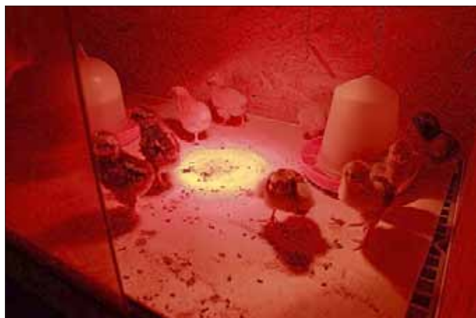
Munter erkunden die Küken das Aufzuchtgehege.