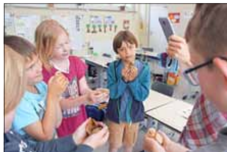
Stolz tragen die Schüler der Klasse 2b „ihre“ Küken auf dem Weg in das Aufzuchtgehege.