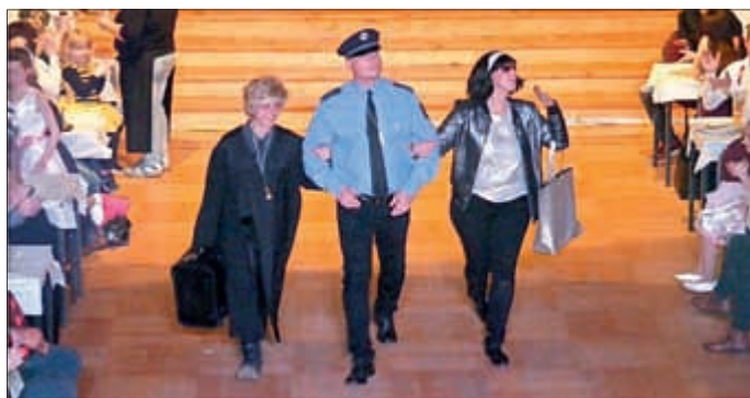
Richter und Angeklagte