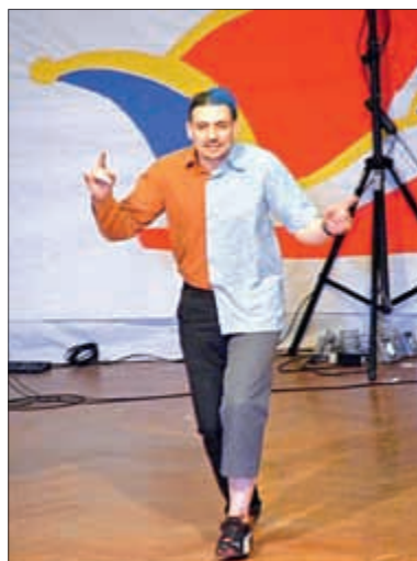
Der gespaltene Mensch