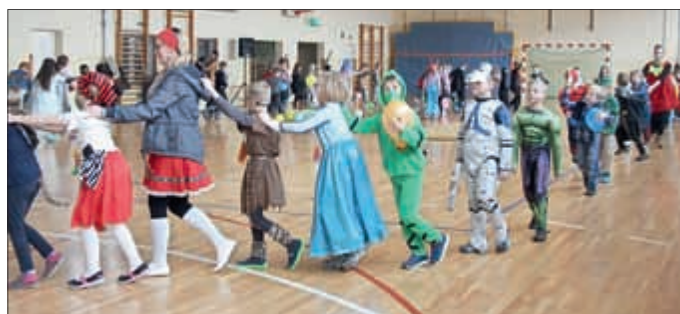
Zum Narrhalla mit Polonaise in die Turnhalle.