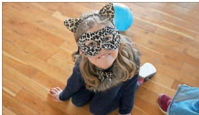
Ein kleines „Raubkätzchen“.