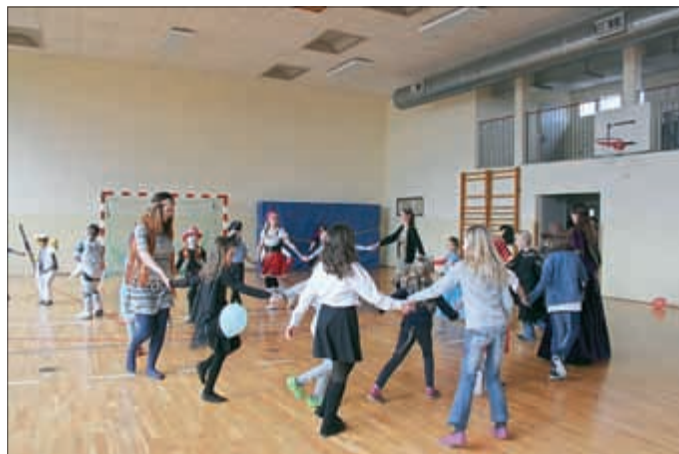
Eine Runde Laurenzia, bitte.