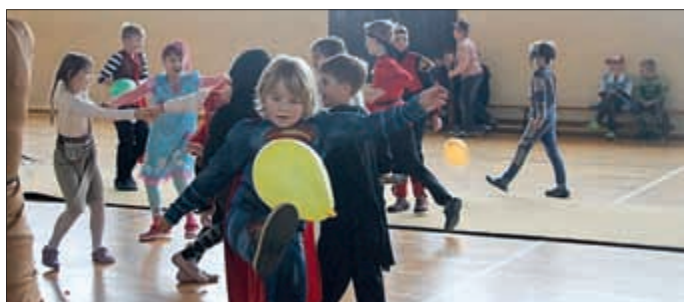
Spiel und Spaß für alle.