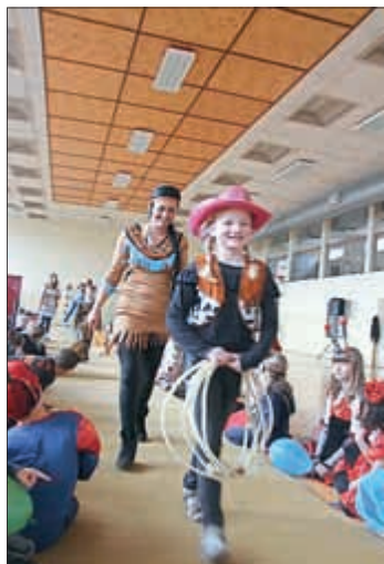
Wir spielen Cowboy und Indianer.