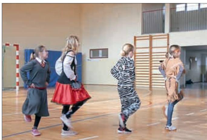
Tanzeinlage von einer Schülergruppe, die im Karnevalsverein aktiv ist.