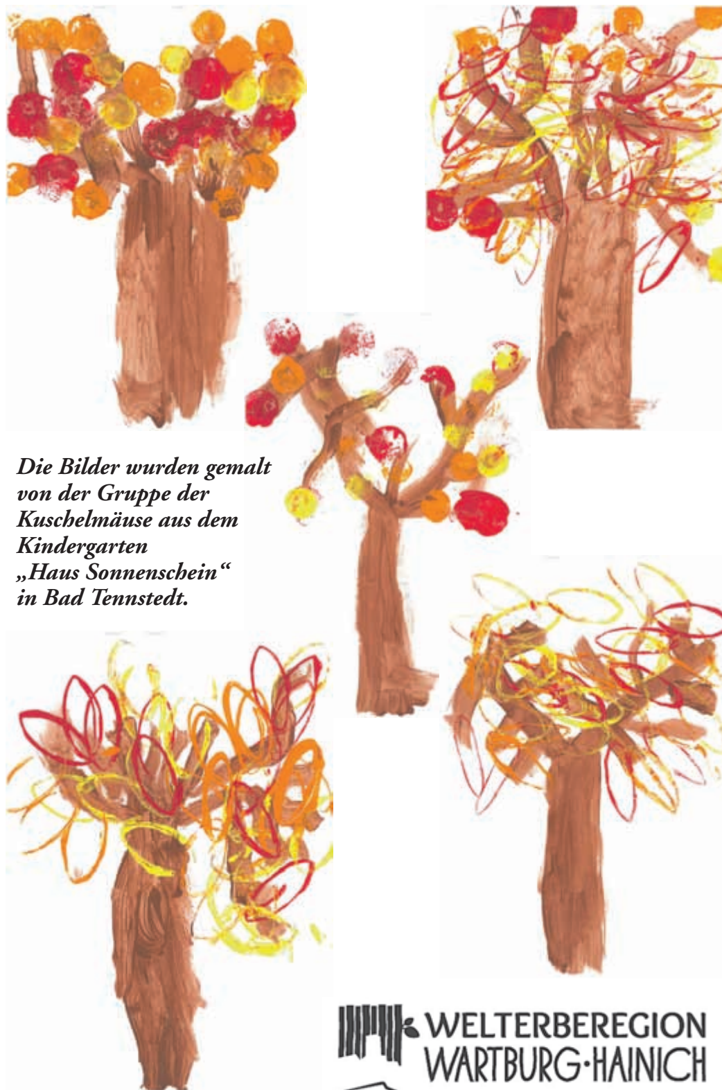
Die Bilder wurden gemalt von der Gruppe der Kuschelmäuse aus dem Kindergarten „Haus Sonnenschein“ in Bad Tennstedt.