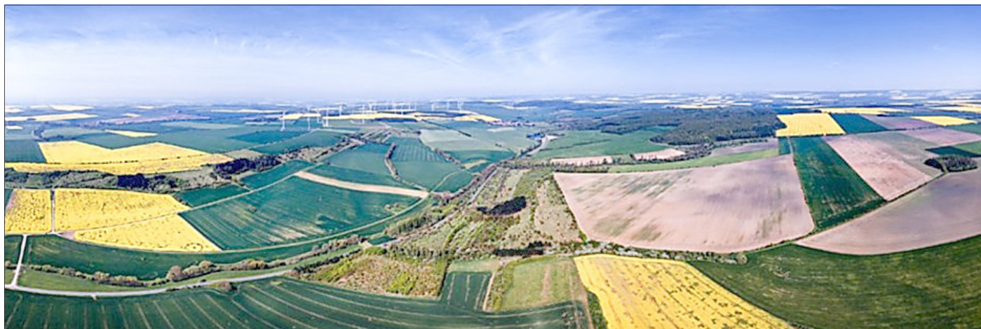
Historische Retentionsanlage im Erosionsgebiet Bruchstedt

Die im Unstrut-Hainich-Kreis gelegene historische Retentionsanlage Bruchstedt auf dem Fernebach-Südhang (Bildmitte) wurde in den frühen 1950er Jahren angelegt. Diese Anlage wurde im Erosionsgebiet angelegt und war als Beispielsanlage gedacht, um zu zeigen, wie in vergleichbaren Situationen in Thüringen Regenwasser in Hanglagen mit wirtschaftlicher Nutzung zurückgehalten werden kann. Gartenarchitekt war Günther Wuttke aus Erfurt. Viele andere Experten haben an dieser Anlage mitgewirkt.