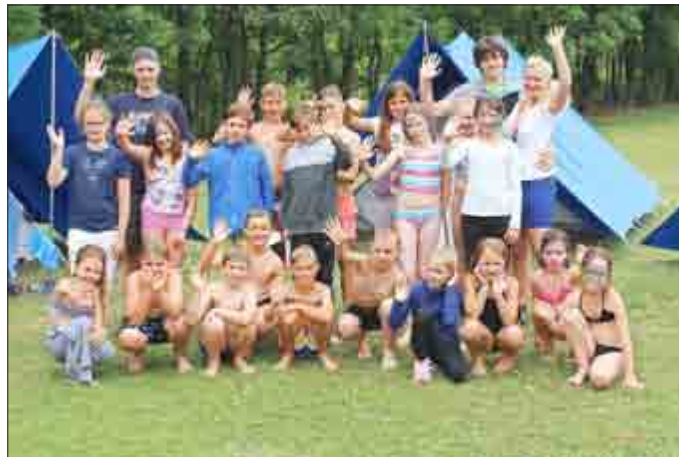
Arbeiterwohlfahrt Bad Langensalza e.V.