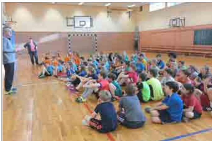
Siegerehrung: die Spannung wächst...