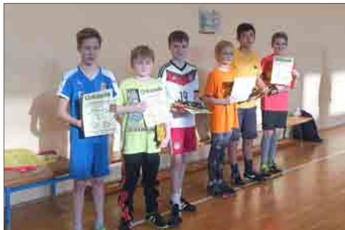
Siegerehrung (von rechts nach links) Grundschulen Kl. 4 / GymGG Kl. 5, 1. Platz 5b (1), 2. GS Großengottern, 3. GS SonnenhofLSZ, 4. 5b (2), 5. GS Thepra Weinbergen, 6. 5a

Konzentriert hörten die Kids den Einweisungen zu, gaben in den Spielen „Jeder gegen Jeden“ aber auch beim Anfeuern anderer Mannschaften ihr Bestes. Bei der Siegerehrung freuten sich schließlich alle über eine Sieger- oder Anerkennungsurkunde, einen Ball sowie Süßigkeiten. Abschließend spielte eine Auswahl der Viertklässler gegen eine Auswahl der Fünftklässler, wobei die Turnhalle bebte. Letztlich war es nicht so wichtig, wer dabei gewann, sondern dass es für alle ein erlebnisreicher Vormittag mit viel Bewegung und neuen Eindrü-