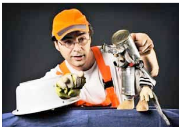
Pressefotos „Ritter Maus“