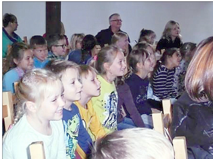
Die Kinder in Kirchheilingen hatten Spaß am Puppentheater

Am Donnerstag war dann in der Veranstaltungsreihe „Bücherzwerge“ das Thema: Gruselige Gespenster und Monster an der Reihe. Handpuppe Mölli, die immer die Kinder begrüßt hatte etwas Angst vor dem Gespenst „Gabriele von Schlotterfels“, das gerade auf der Durchreise in Bad Tennstedt war. Die Kinder lauschten der Geschichte von der Gespensterparty, die mit Schwarzlicht angestrahlt wurde und so im Dunkeln leuchtete. Auch die Geschichte vom Monster unter dem Bett als Bilderbuchkino war spannend und die Kinder zeigten ihren Mut beim Spiel: „Gespenster fangen“ und fischten auch aus einer schleimigen Masse gruselige Spinnen, Skelette und Glupschaugen. Ihr Mut wurde dann mit leckeren Milchgeistern und Regenwürmchen als Gummitierchen belohnt.