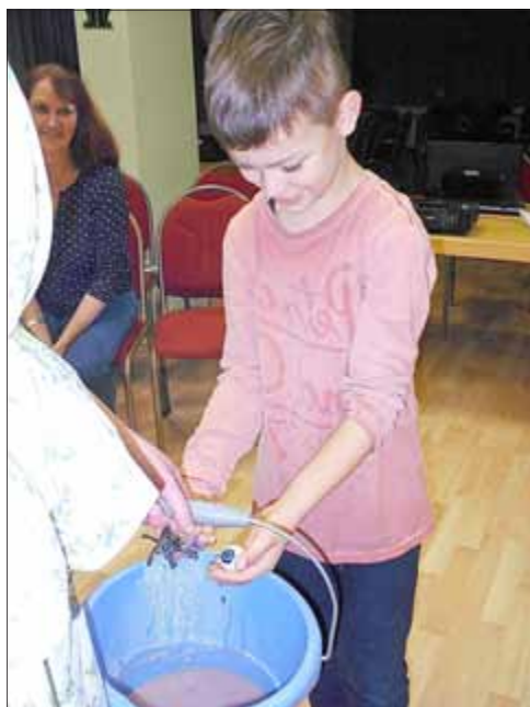
Malte fischt aus der Schleimbrühe eklige Spinnen und Augen