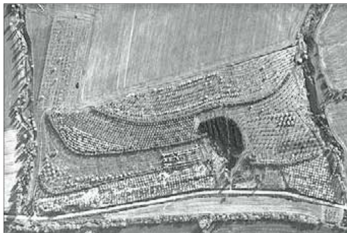
Luftbild vom Erosionsgebiet Bruchstedt, 1980

29.9.2016 Gemeinde Bruchstedt, Kulturhaus und Erosionsgebiet