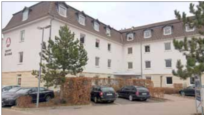
Der Fachdienst Sicherheit und Ordnung steht Bürgern ab sofort in der 2. Etage des Gebäudes der Agentur für Arbeit in der Thomas-Müntzer-Straße in Mühlhausen zur Verfügung.