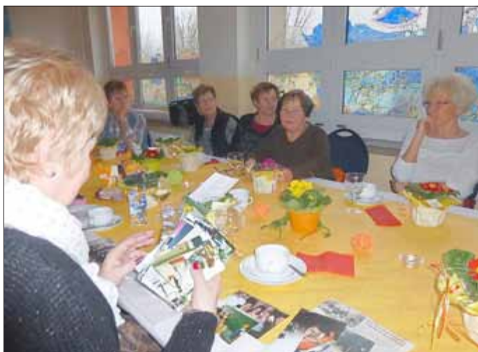
Frau Ludewig hatte Fotos mitgebracht.