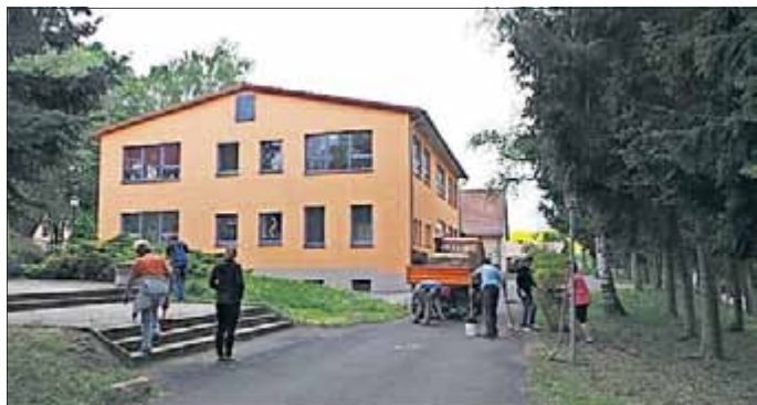
Arbeitseinsatz am 09.05.2015