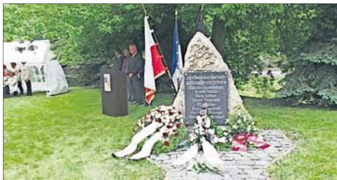
Gedenkveranstaltung am 23. Mai 2015