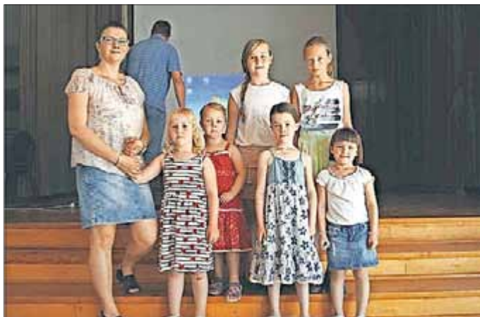
Überraschungsprogramm des BCV