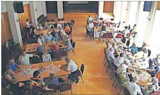
Bruchstedter Jahrgangstreffen und Rentnernachmittag