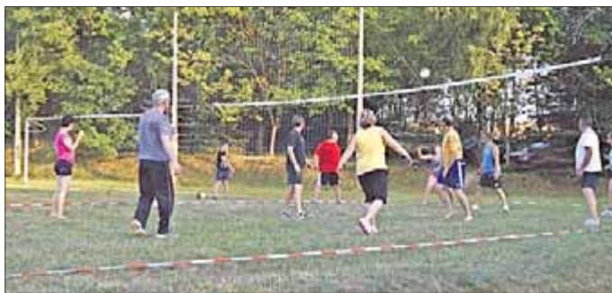
Volleyballturnier der Freizeitmannschaften