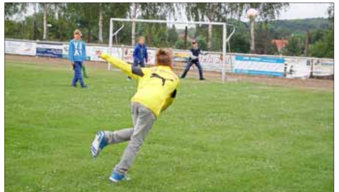
Nach den Fußballgeschichten durfte noch gebolzt werden