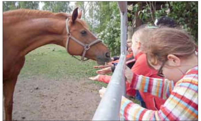
Möhren als Leckerli kommen auf dem Reiterhof gut an