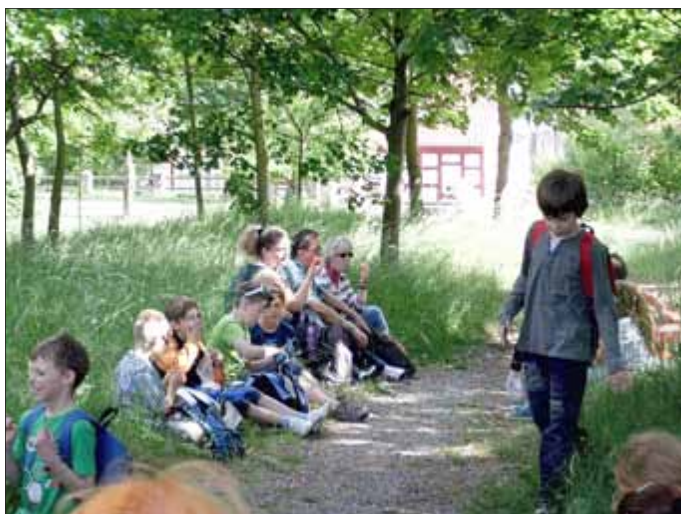
Pause und Picknick dürfen nicht fehlen