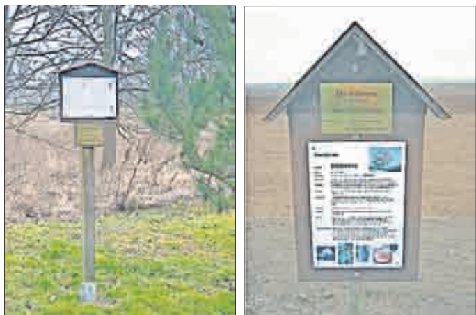
Standtafeln mit Baumbeschreibung und Angaben zum Sponsor