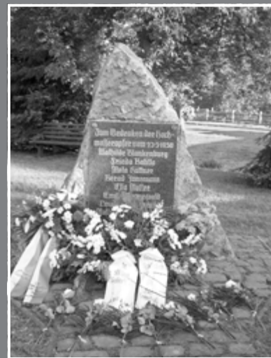
Erinnern an die Flutkatastrophe Der Opfer gedenken Den Helfern danken