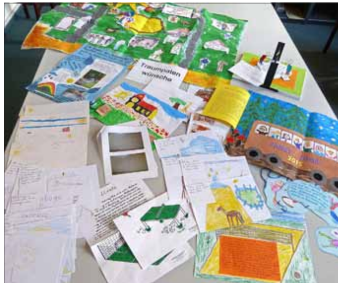
Ein Überblick über die zahlreichen Einsendungen zum Wiederauftakt der Traumpatenaktion.