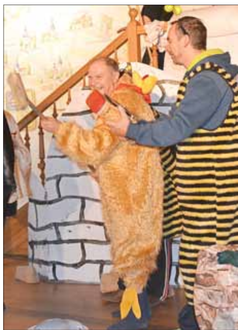
Ausschnitt aus Frau Holle - Märchen für Erwachsene