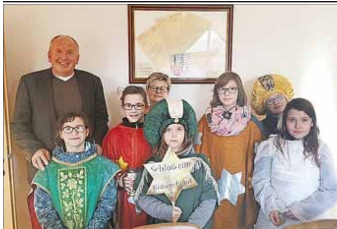
Die Schlotheimer Sternsinger beim Bürgermeister.