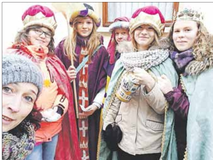
Die Bothenheilinger Sternsinger.