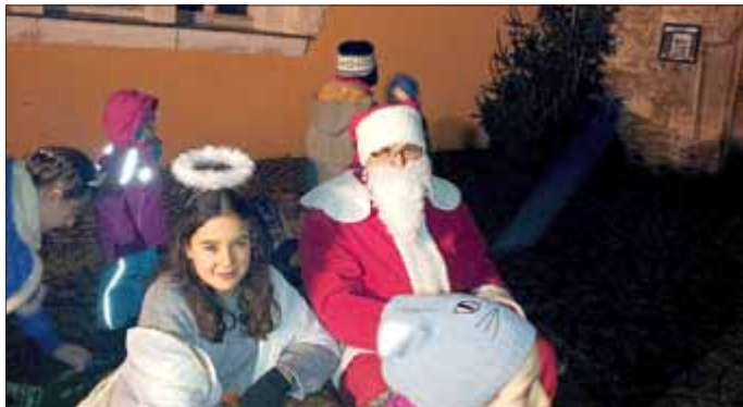
Himmliche Weihnachtsboten und Lieblinge der Gäste