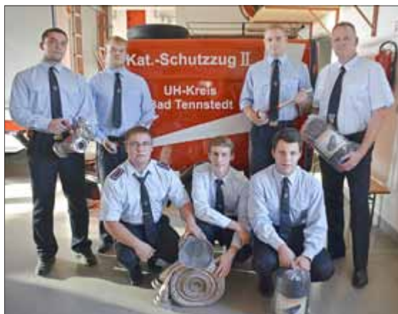
Die Löschangriffmannschaft der Freiwilligen Feuerwehr Bad Tennstedt