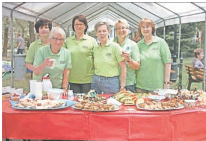
Gute Versorgung durch den Kneippverein