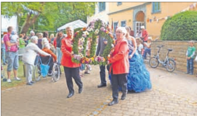
Zug zur Quelle