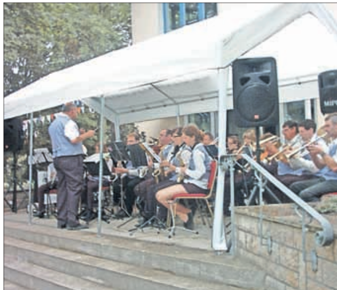
Das Orchester des Kultur- und Heimatvereins