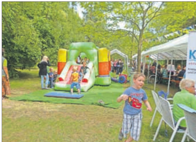
Hüpfburg - immer umlagert