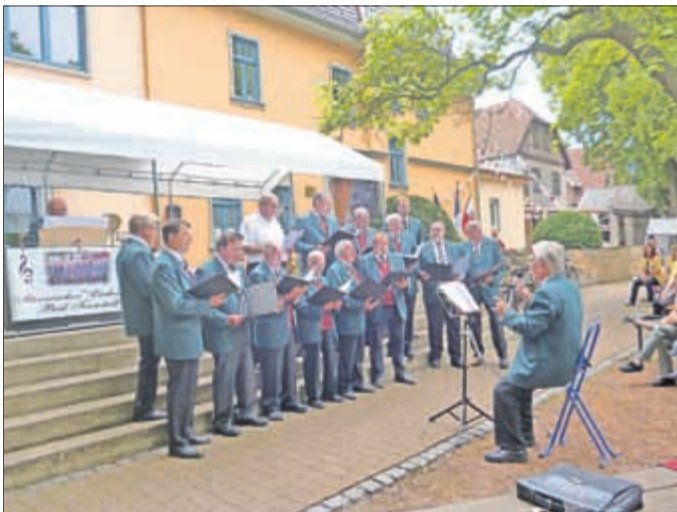
Auftritt vom Männerchor Liedertafel