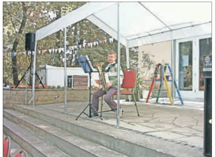
Viel Applaus für den Künstler