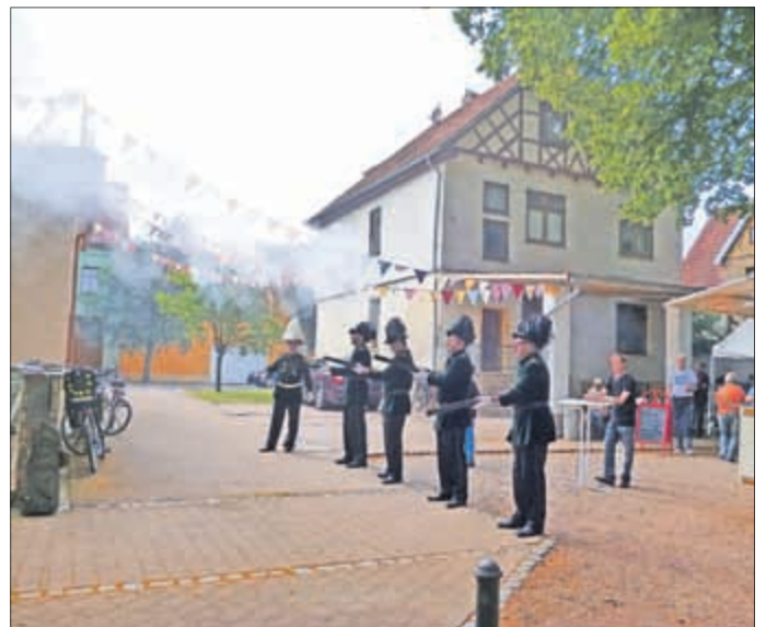
Salut zur Eröffnung