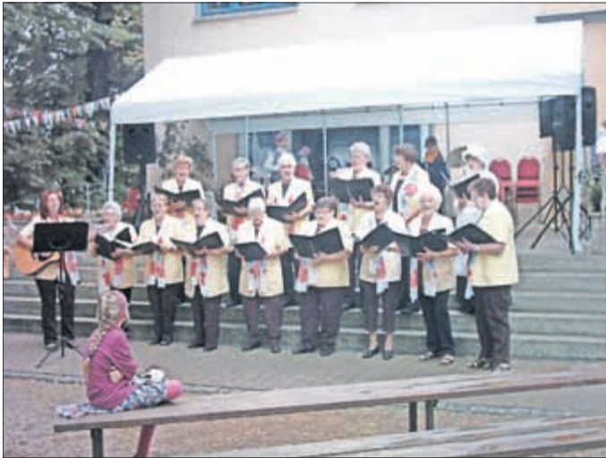
Bad Tennstedter Frauenchor