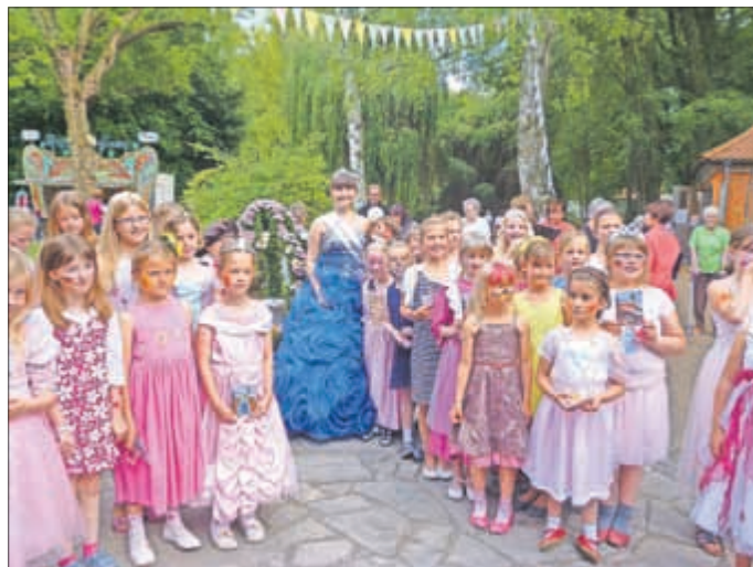
Gruppenbild mit Quellprinzessin