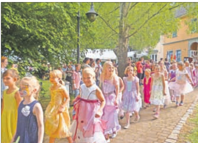
Zug der kleinen Prinzessinen