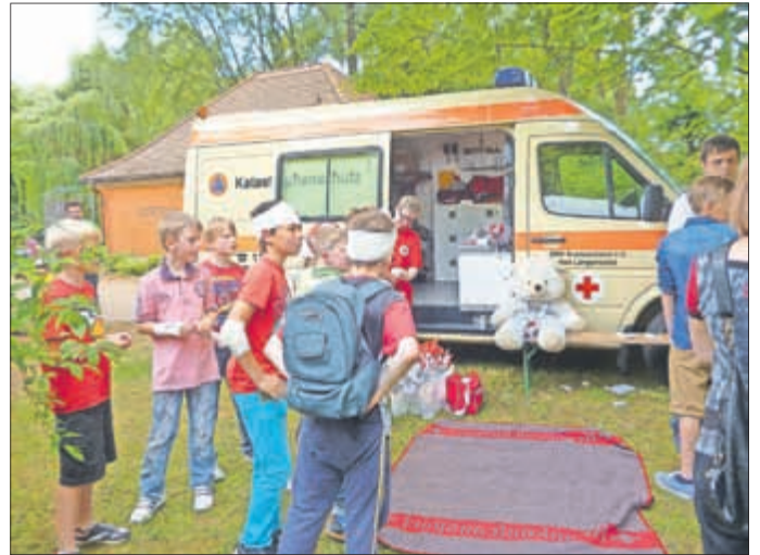
Viele Verletzte beim DRK