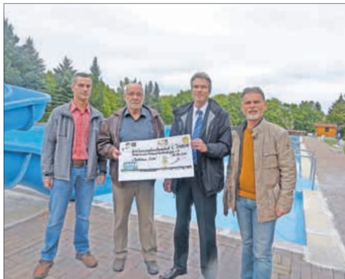
Auch das Kirchheilinger Freibad verfügt über einen eigenen Linien.