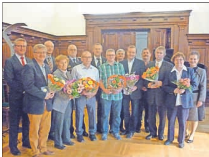
Preisträger und Laudatoren fanden sich zu einem Gruppenbild zusammen.