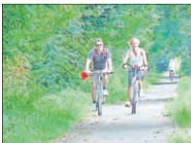
Radfahren macht Spaß und ist gesund!

Er wird gemeinsam mit seiner Frau an der Tour teilnehmen. Am 02. August 2014 geht es um 9 Uhr an der Kirche los. Die Ankunft in Wendehausen ist zwischen 14 und 15 Uhr geplant. Interessierte Fahrradfans können sich ab 01. Mai 2014 auf der Internetseite des Landratsamtes Unstrut-Hainich-Kreis unter www.unstrut-hainich-kreis.de anmelden. Die Teilnahme an der Jubiläumstour ist selbstverständlich kostenlos. Seien Sie dabei!!!