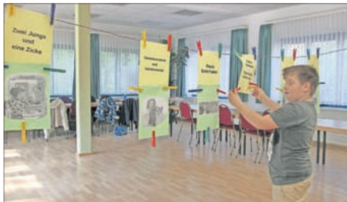
Till hängt eine Illustration zum Buchtitel