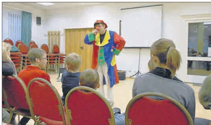
Ugolino telefoniert mit Rotkäppchens Oma