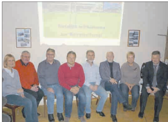
Der Regionalbudget-Beirat bei seiner Tagung im Öbsterstübchen in Kirchheilingen.