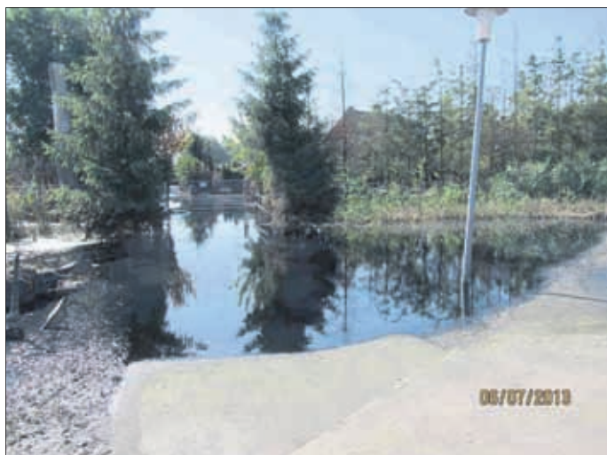
Unter Wasser stehende Einfahrt zum Grundstück des Fischers Gernot Quaschny