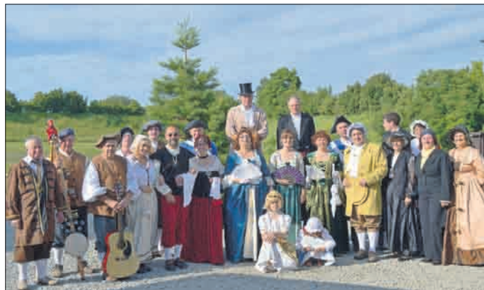
alle Mitwirkenden des Theaterstücks