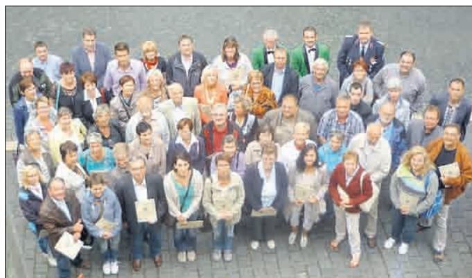
Die Ehrenamtlichen im Unstrut-Hainich-Kreis präsentieren stolz ihre Fördermittelbescheide.

Jeder Dritte in Deutschland engagiert sich für die Allgemeinheit. Das sind rund 22 Millionen Mitbürger. Viele Bereiche des öffentlichen und sozialen Lebens würden ohne Ehrenamtliche kaum mehr existieren. Zanker dankte den Anwesenden für ihre unentgeltlichen Dienste zum Wohle der Allgemeinheit und verwies darauf, dass gesellschaftliches Miteinander sowie moralische Werte und Tugenden wieder stärker in das Zentrum unserer Gesellschaft integriert werden müssen.