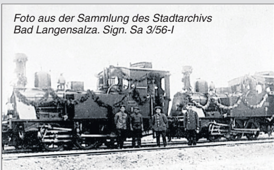
Sign. Sa 3/56-I

Mit Nostalgiefahrten vom Bahnhof Bad Langensalza Ost zum Bahnhof Kirchheilingen und zurück.