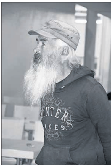
Der alte Mann