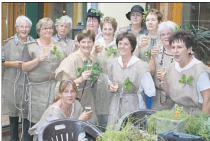
Gäste beim Räuberdinner Jagd in 2011 „Jagdges Sportgruppe2“

Steinweg 23, 99955 Bad Tennstedt, Telefon 036041-34049,