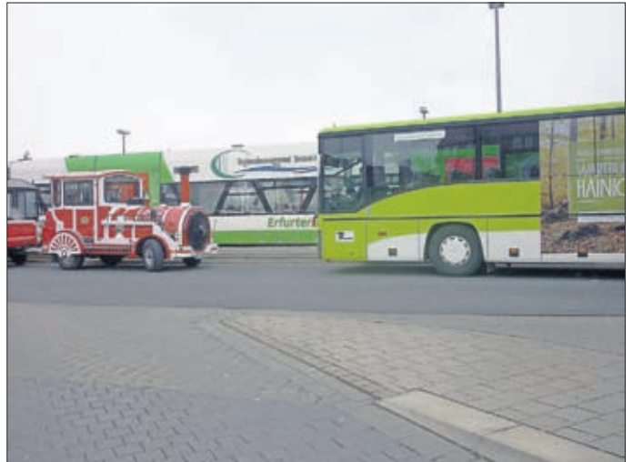
Tschu-Tschu-Bahn, Erfurter Bahn und ein Bus der Regionalbusgesellschaft trafen am Mühlhäuser Bahnhof zusammen. Sie sollen sinnvoll miteinander verknüpft werden und für umweltfreundliche und erlebnisreiche „Mobilität in der Hainich-Region“ sorgen.