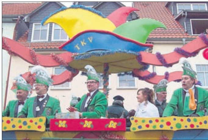
TKV: Mit 60 weise und trotzdem nicht leise