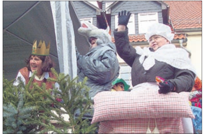
Frauenchor: Lassen sich von Niemandem Märchen erzählen