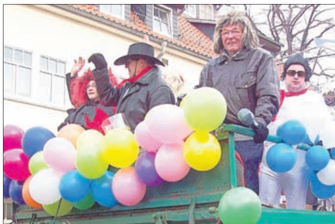
Liedertafel: Sie gratulieren und rocken die 60