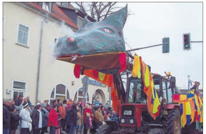
Offizieller Abschied von 2012, dem Jahr des Drachen