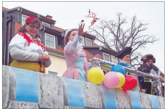
KHV: Wir stecken einfältige Geister in den Katzer