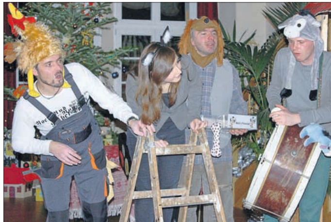
Gauschimmel, Waldi, Miezi und Hähnlein