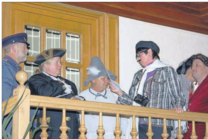
Die besorgten Bürger von Bad Tennstedt