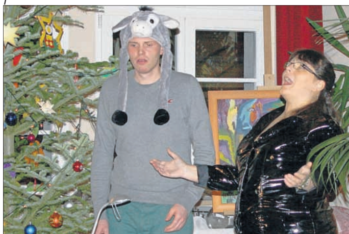
Herr Gauschimmel mit Chefin