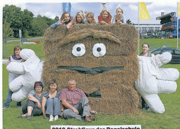
2010 Strohfigur der Regelschule