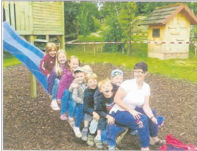
Unsere Schulkinder im Ferienlager Rittergut Lützensömmern.