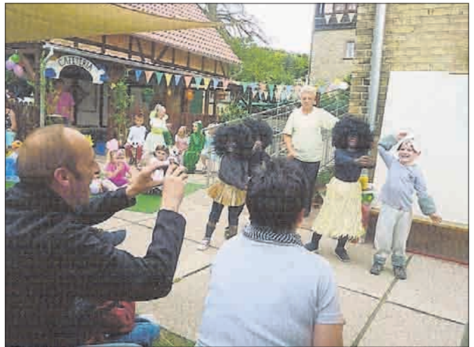
Afrikaner gaben ein Stelldichein und brachten auch den Elefanten mit zum Tierfest.