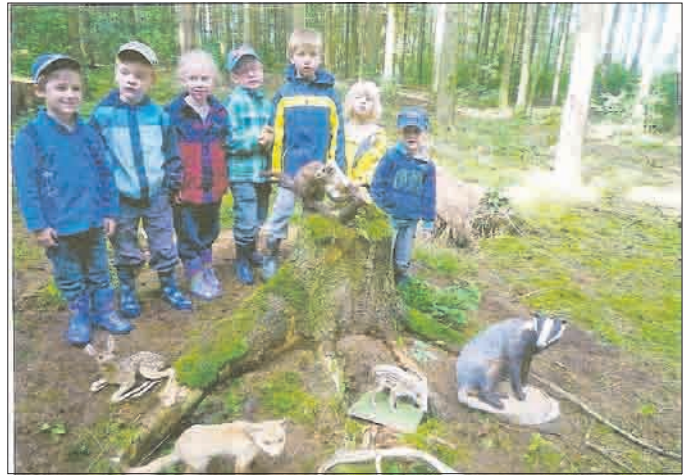
Wir lernten viel über Waldtiere.