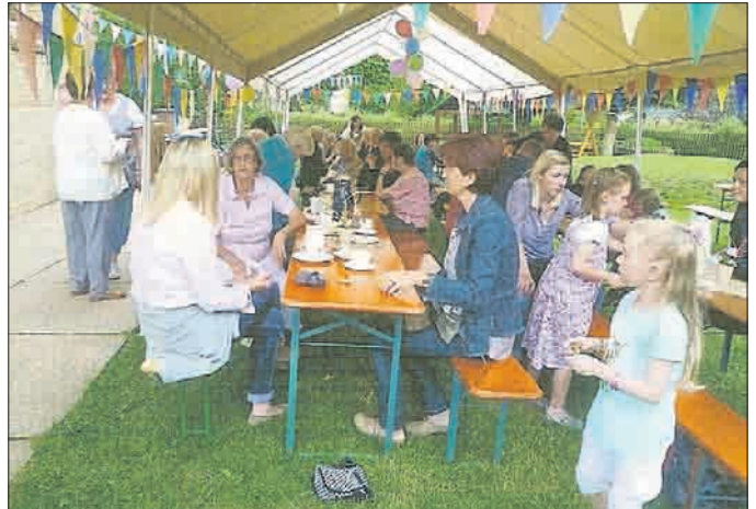
Der Familientag in Mittelsömmern war wieder gut besucht.