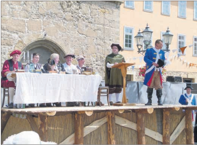
Richtstätte mit dem Hohen Rat