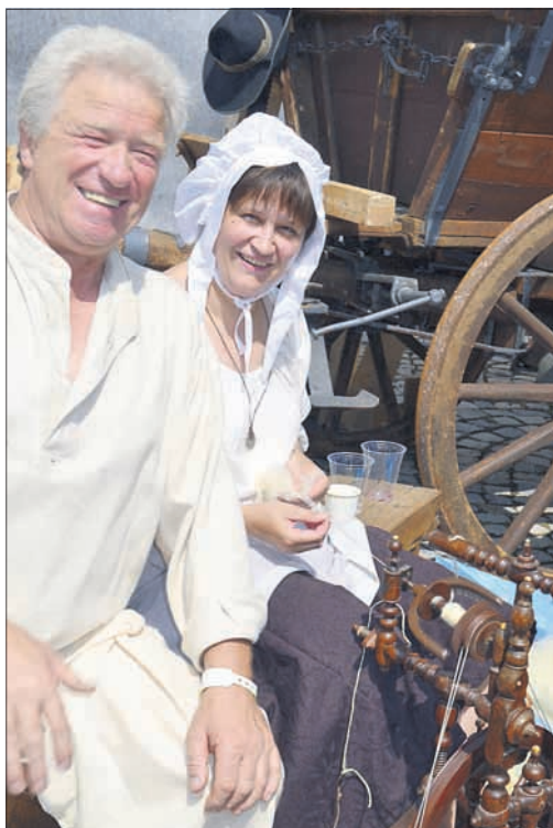
Hier wird echt gesponnen