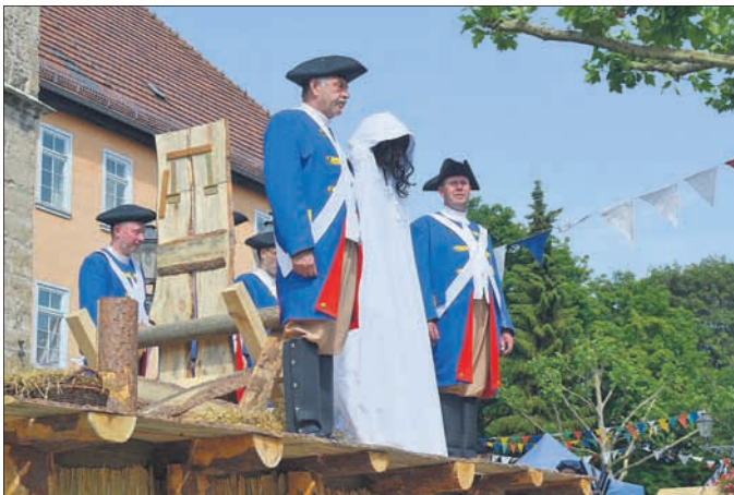
Übergabe des Verurteilten