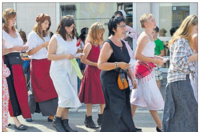
Totengesang vom Gnadenchor