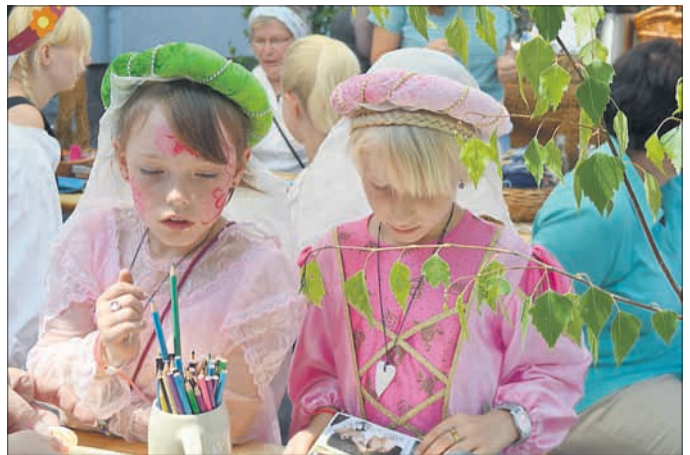
Zwei junge Edeldamen