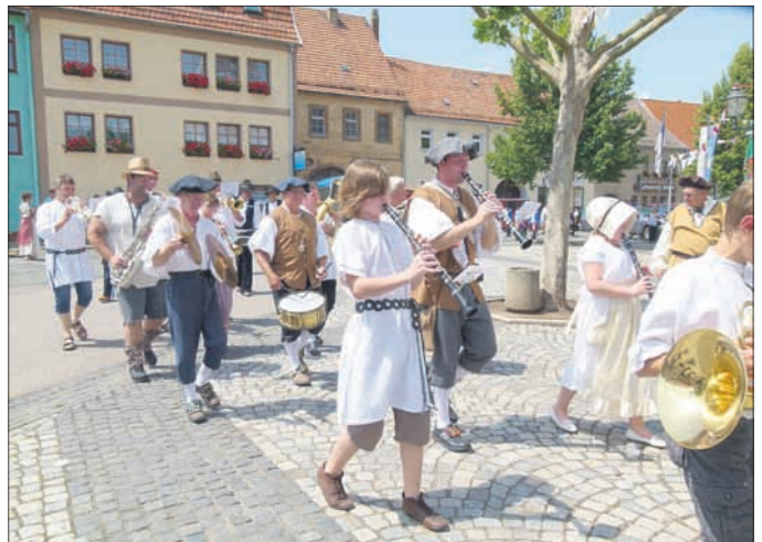
Einzug der Gewerke