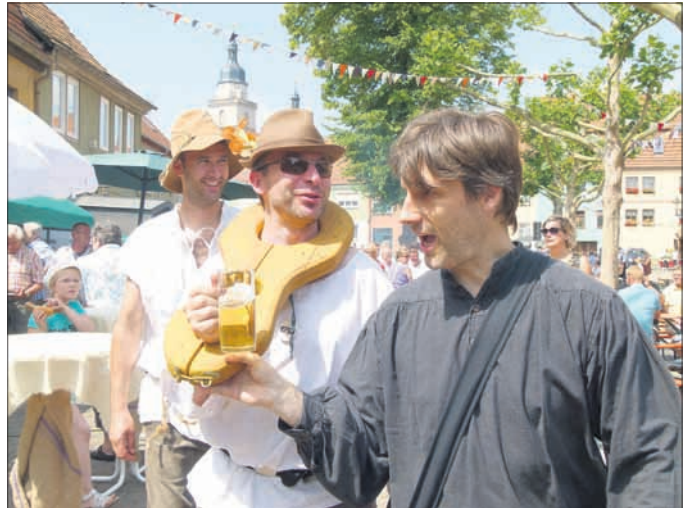
Taschendiebe auf Abbitte

Ihr Kultur- und Heimatverein Bad Tennstedt e.V. Steinweg 23, 99955 Bad Tennstedt, Telefon 036041-34049, Internet: www.khv-badtennstedt.de , email: info@khv-badtennstedt.de