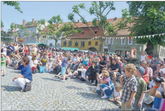
Ein gebanntes Publikum