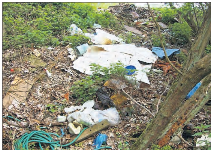
Gemarkung Kutzleben 2012 - Am Hornsömmerschen Weg