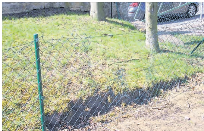
zerstörter Zaun Kinderspielplatz

Schauen Sie nicht weg, wenn unser Wohnumfeld als Müllhalde genutzt wird oder Anlagen und Plätze beschädigt werden! Benennen Sie die Täter! Denken Sie daran, dass es auch Ihr Geld ist, das die Gemeinde für die Entsorgung und Instandsetzung aufwenden muss, dass dringend für notwendige Maßnahmen benötigt wird.