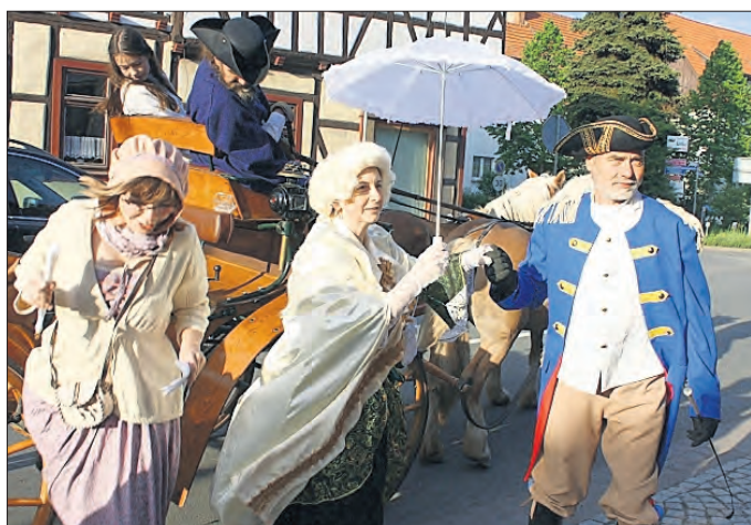
Anreise der Hochzeitsgäste per Kutsche.