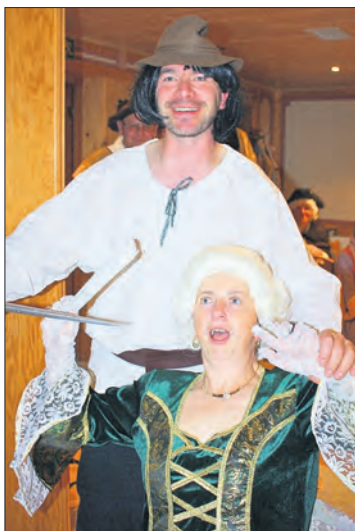
Gräfin Friederike und der Juwelen-Raub

Ihr Kultur- und Heimatverein Bad Tennstedt e.V. Steinweg 23, 99955 Bad Tennstedt, Telefon 036041-34049, internet: www.khv-badtennstedt.de, email: info@khv-badtennstedt.de