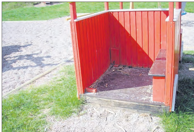
Zerstörte Sitzbank Kinderspielplatz

Insbesondere in Zeiten klammer Kassen, in denen es für Kommunen immer schwieriger wird - ob personell oder finanziell - ihre Aufgaben umfassend wahrzunehmen, ist es nicht mehr ausreichend lediglich seiner Straßenreinigungspflicht als Grundstückseigentümer nachzukommen. Hier geht es um die allgemeine Bürgerpflicht!