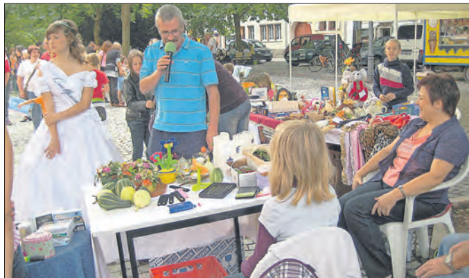
Selbstgebasteltes, Selbstangebautes mit Liebe Präsentiertes