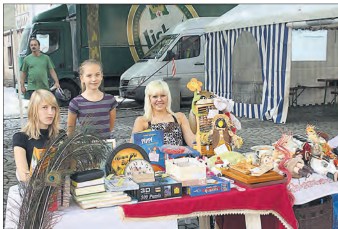
Wer nicht lächeln kann, sollte keinen Laden aufmachen. (Aus China)