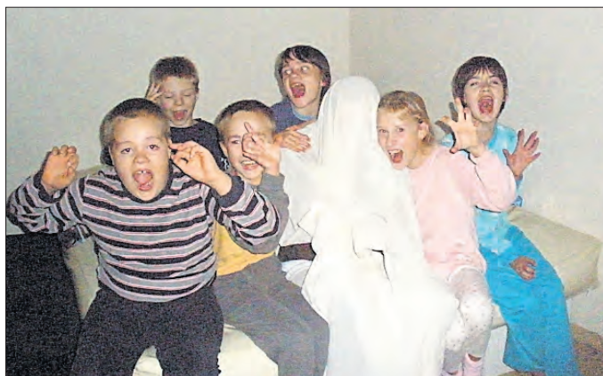
Der Geist spukt herum.