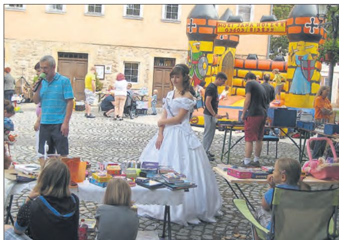
Herzstück des Strohballenfestes: Kinderflohmarkt

schrunk und vieles mehr wurde zum Kauf angeboten. Das Wetter war herrlich, prominente Besucher waren zugegen und in den Verkaufspausen konnten die Kids bei allerlei Spaß und Spiel kleine Verschnaufpausen einlegen.