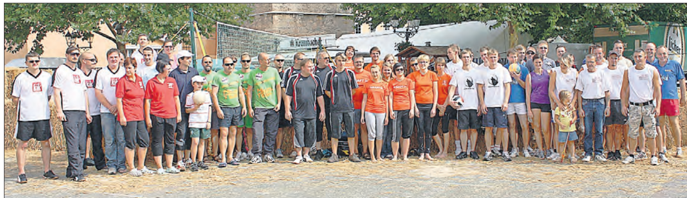
Mannschaftsfoto aller Teams