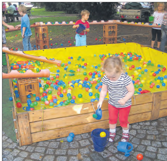
Wasserspiele als magischer Anziehungspunkt.