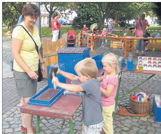
Aktive Entspannung an der Sinnesstraße.