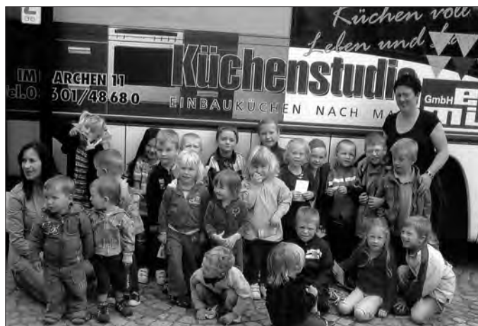
Kinder der Kita „Kinderland am Horn“ Mittelsömmern