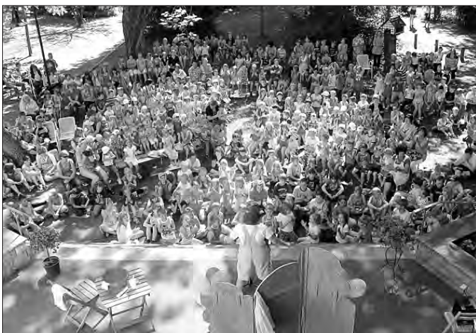
Kinder der Kitas und der Grunschule kamen zum Gesundheitstag in den Kurpark