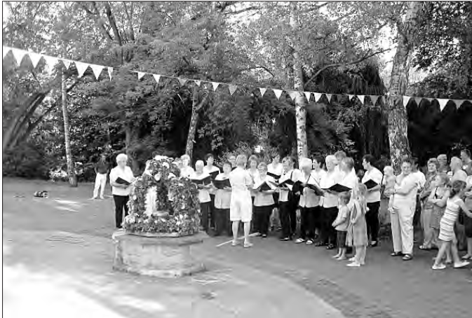
Der Frauenchor, Quellprinzessin, Ehrengäste und Kinder ziehen mit der Krone zur Quelle.