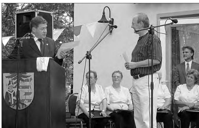
Ehrung des Fördervereins „St. Trinitatiskirche“ für die Arbeiten an der Gottesackerkirche.