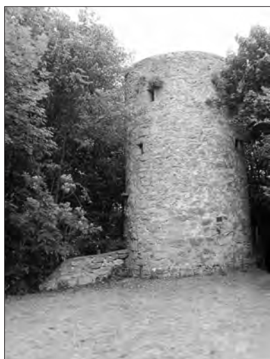
Der Turm und das Gelände nach dem Arbeitseinsatz.