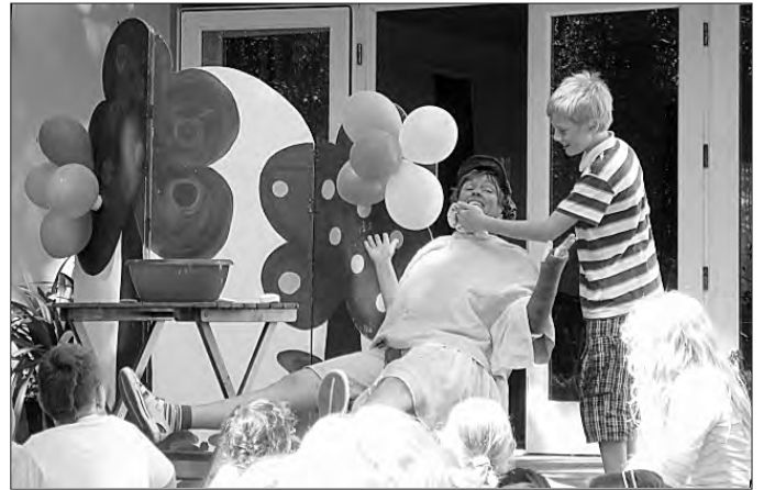
... um beim Programm „Jule wäscht sich nie“ mitzumachen