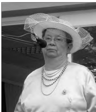
Besuch von Queen Mum im Kurpark.