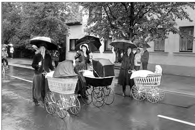
Leider fiel der Umzug ins Wasser - trotzdem war es ein gelungenes Fest!