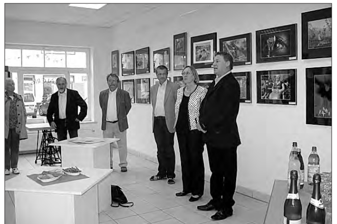
Fotoausstellung in der Galerie „Am Osthöfer Tor“ ist noch bis Ende Juli zu sehen.