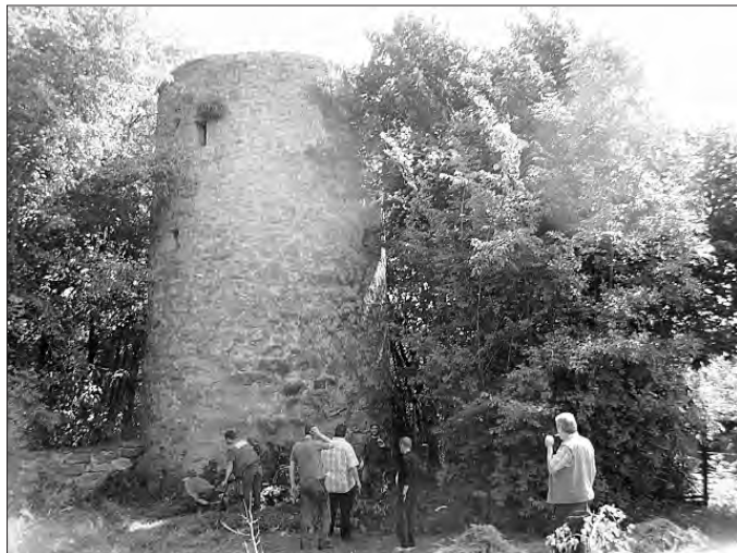
Der Turm vor dem Arbeitseinsatz.