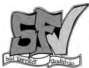
Förderverein der staatlichen Regelschule Bad Tennstedt: „Novalisschule“ e.V.