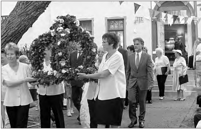
Feierlicher Zug zur Quelle.