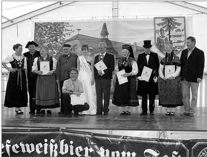
Unsere Quellprinzessin begrüßt gemeinsam mit dem Landrat die Teilnehmer des Kreistrachtenfestes.