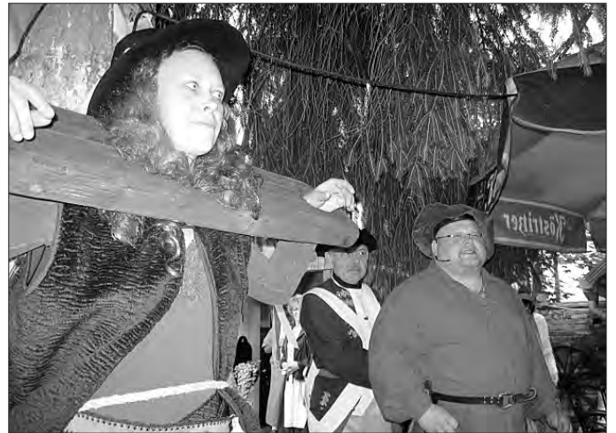
... und am Ende wurde der Schwarze Fritz“ und seine Frau gefangen.