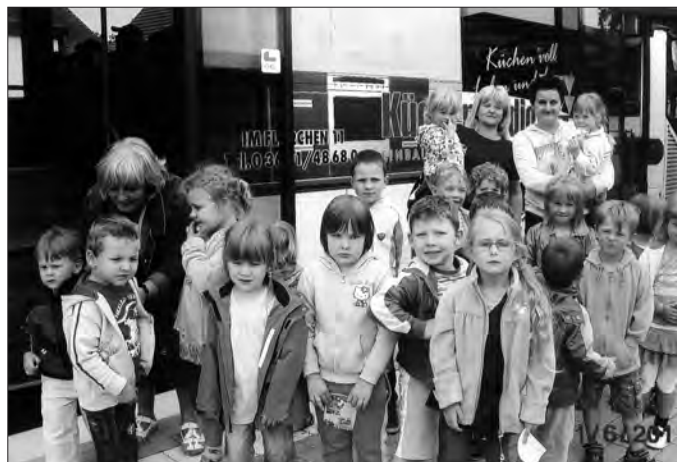
Kinder der Kita „Pfiffikus“ Kutzleben

Die Kinder, Erzieher und Eltern der Kitas „Pfiffikus“ Kutzleben und „Kinderland am Horn“ Mittelsömmern