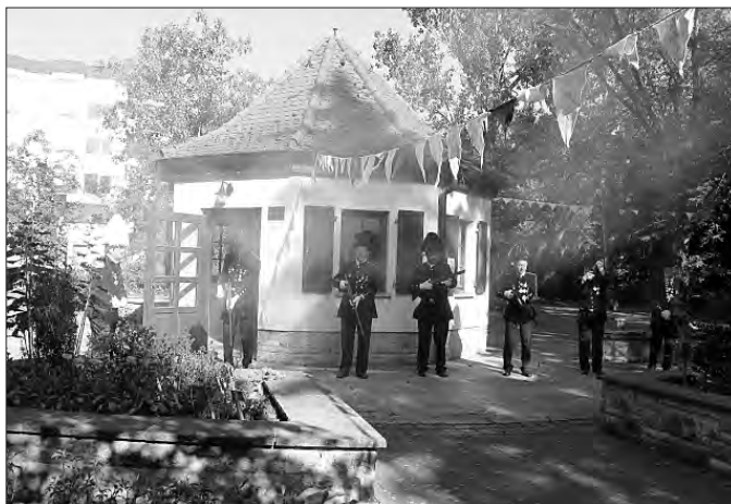
Eröffnung des Heimat- und Brunnenfestes durch Böllerschüsse der Schützengilde

Hier nun einige Bilder von Veranstaltungen - mehr Bilder finden Sie unter www.badtennstedt.de