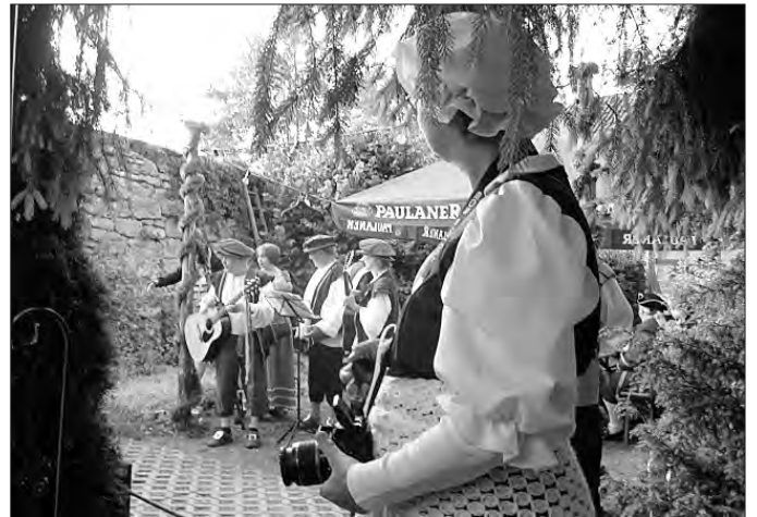
... auch die „Räuberdinner“ waren ein voller Erfolg